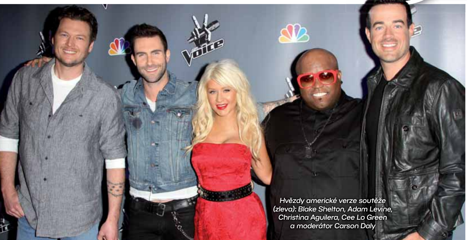
Hvězdy americké verze soutěže (zleva): Blake Shelton, Adam Levine, Christina Aguilera, Cee Lo Green a moderátor Carson Daly