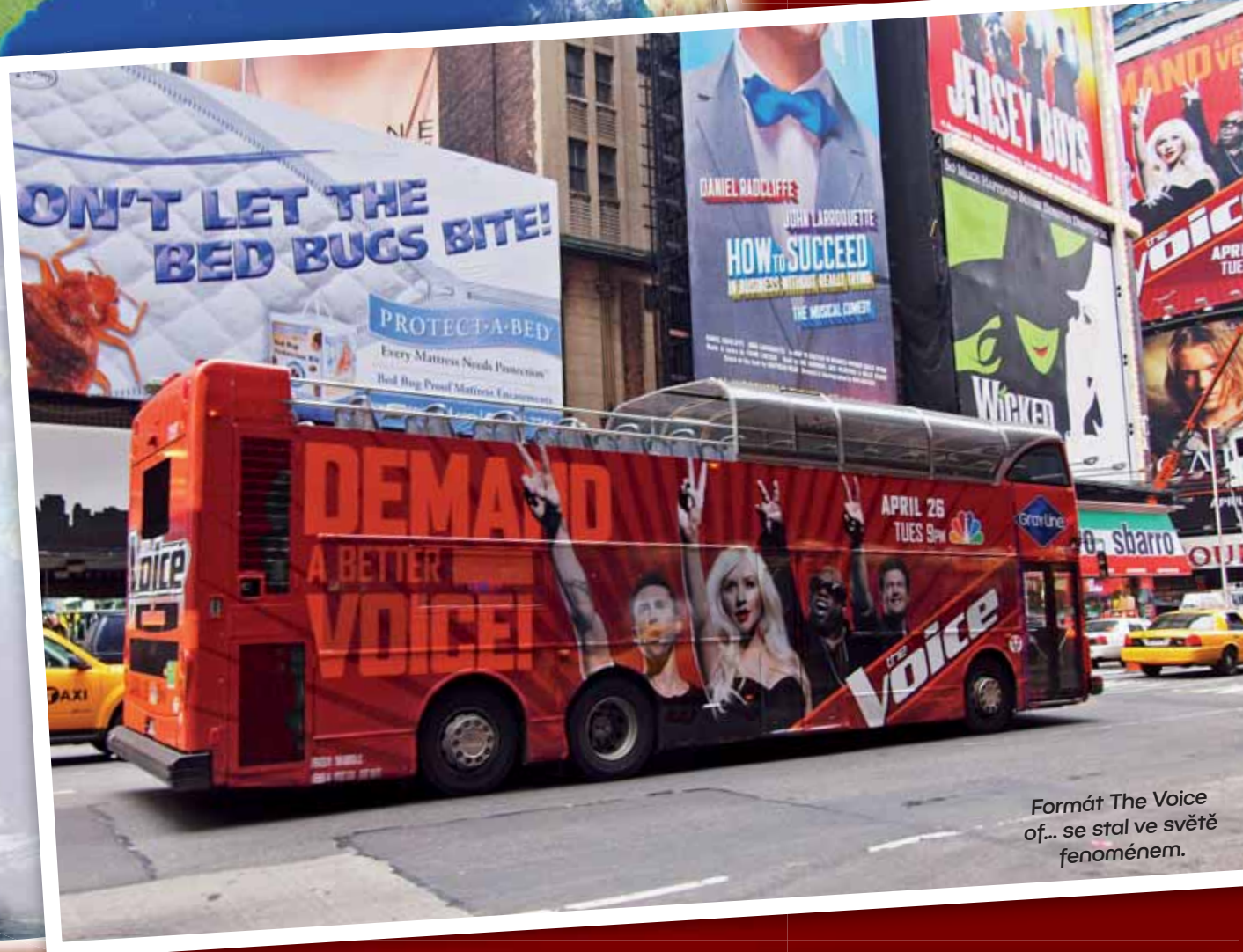
Formát The Voice of... se stal ve světě fenoménem.