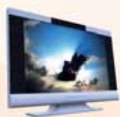
Omezená nabídka DIGITAL