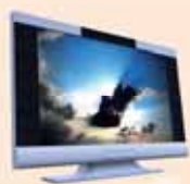
Omezená nabídka DIGITAL