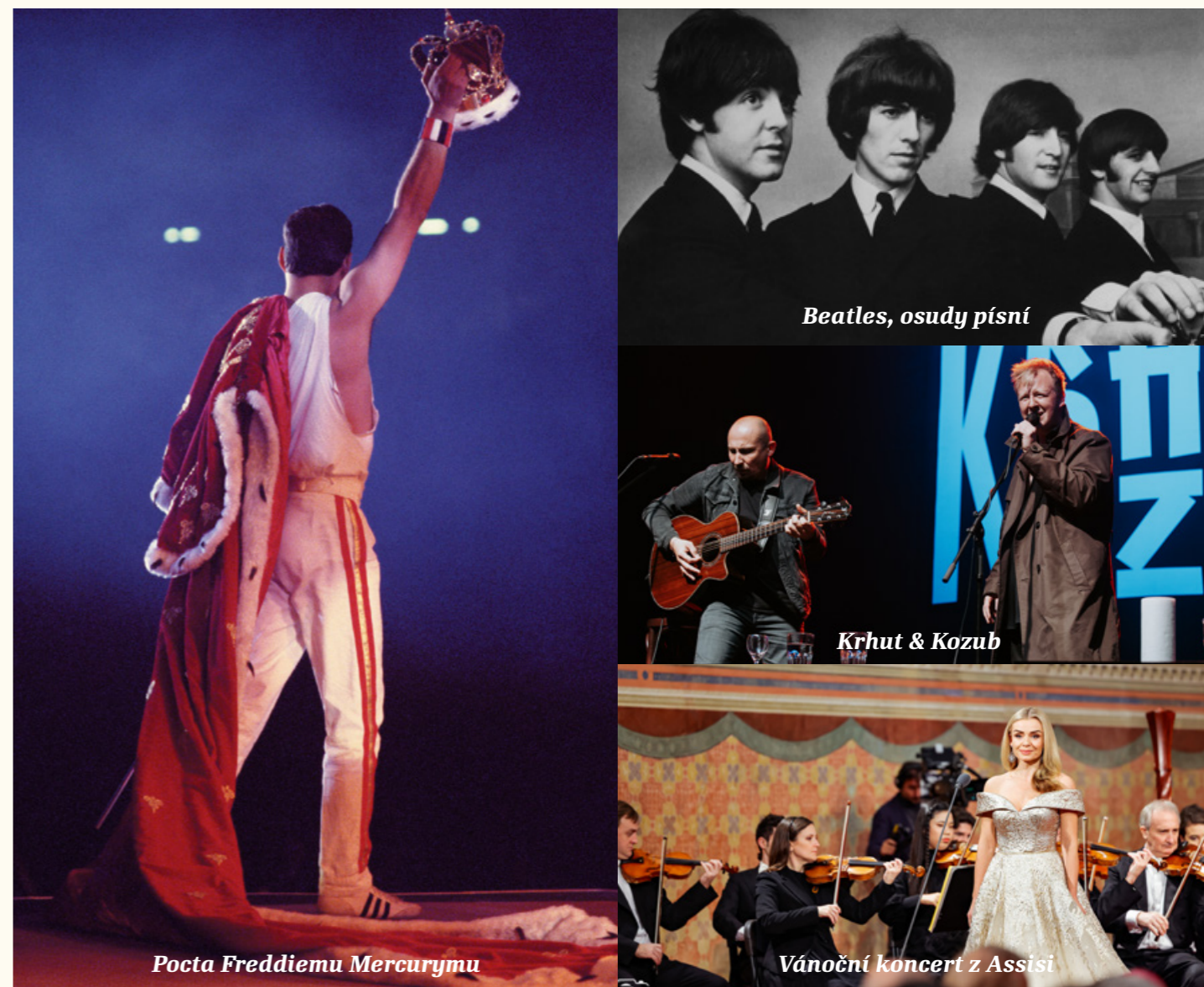
Beatles, osudy písní