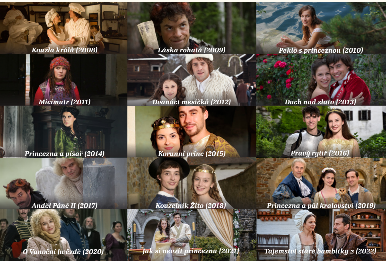
Kouzla králů (2008)