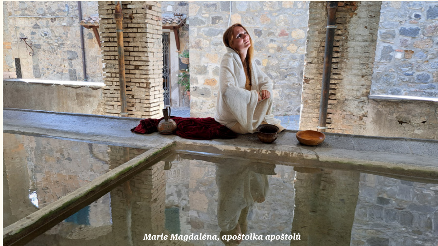
Marie Magdaléna, apoštolka apoštolů