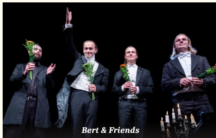
Bert & Friends

Dostupné budou také oceňované evropské filmy, například dramata Blízko , Paralelní matky , Milý tati nebo 107 matek . Retrospektivy hned tří výrazných režisérských osobností budou v iVysílání ČT ke zhlédnutí už od začátku adventu. V nabídce budou tituly amerického tvůrce Woodyho Allena - Jasmíniny slzy , Deštivý den v New Yorku , Kolo zázraků nebo Café Society . Z filmografie Jana Svěráka pak oblíbené snímky Akumulátor 1 , Kolja , Kuky se vrací , Tmavomodrý svět , Obecná škola , Po strništi bos , Tatínek , Vratné lahve , Tři bratři , Jízda a Ropáci . Tvorbu režiséra Jana Hřebejka si zájemci mohou připomenout jeho úspěšnými filmy Horem pádem , Musíme si pomáhat , Pelišky , Pupendo a Šakalí léta .