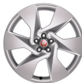
20" KOLA SE 6 PAPRSKY (STYLE 6007) Standardní výbava pro I-PACE SE