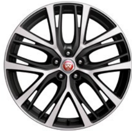
20" KOLA S 5 DVOJ. PAPRSKY TECHNICAL GREY, DIAMOND TURNED (STYLE 5070)