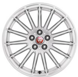
18" KOLA S 15 PAPRSKY (STYLE 1022) Standardní výbava pro I-PACE S