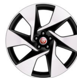
20" KOLA SE 6 PAPRSKY DIAMOND TURNED (STYLE 6007)