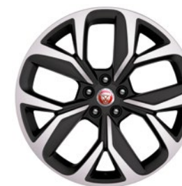
20" KOLA S 5 PAPRSKY DIAMOND TURNED (STYLE 5068) Standardní výbava pro I-PACE HSE