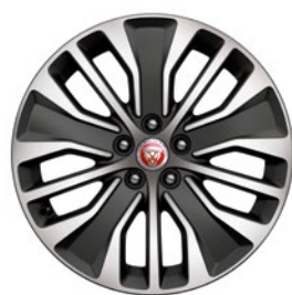
18" KOLA S 5 DVOJ. PAPRSKY DIAMOND TURNED (STYLE 5055)