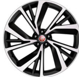
22" KOLA S 5 DVOJ. PAPRSKY DIAMOND TURNED (STYLE 5056)