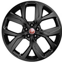
20" KOLA S 5 PAPRSKY GLOSS BLACK (STYLE 5068)