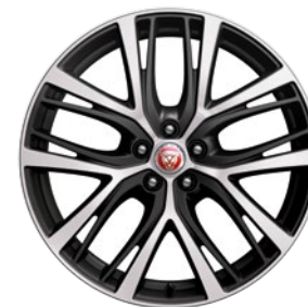
20" KOLA Z LEHKÉ SLITINY S 5 DVOJITÝMI PAPRSKY, TECHNICAL GREY, DIAMOND TURNED (STYLE 5070)

V interiéru si lze zvolit z barevných provedení v odstínu Ebony nebo Light Oyster s exkluzivní kombinací čalounění stropu velurem Premium, lesklé obložení v odstínu Charcoal Ash, kobercové rohože a lišty nastupních prahů s nápisem First Edition.