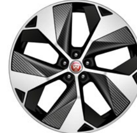
22" KOLA S 5 PAPRSKY GLOSS BLACK, DIAMOND TURNED, S PRVKY Z UHLÍKOVÉHO KOMPOZITU (STYLE 5069)