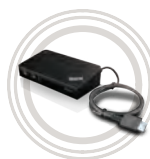
ThinkPad® OneLink Pro dok

Speciální dokovací stanice pro ThinkPad®