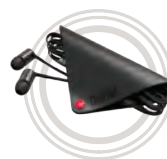
ThinkPad® X1 In Ear sluchátka

Speciální dokovací stanice pro ThinkPad®