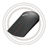
ThinkPad® X1 bezdrátová myš

Bezdrátově připojte a zvyšte funkčnost vašeho zařízení.