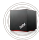
ThinkPad® WiGig Dock

Bezdrátově připojte a zvyšte funkčnost vašeho zařízení.