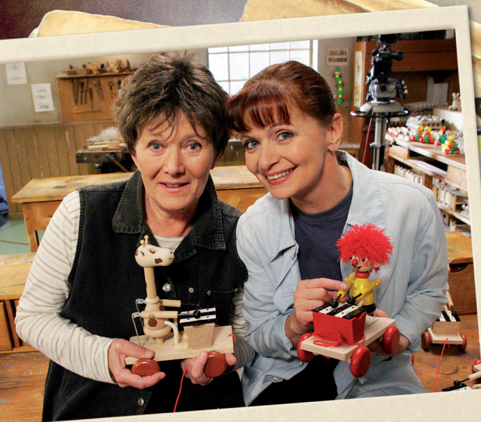
1. sezóna 2005-2006