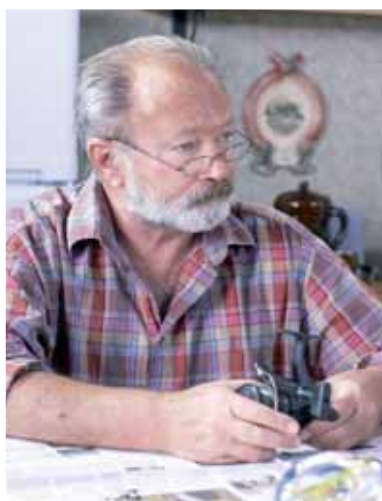
Rudolf Hrušínský Vlastimil Pešek