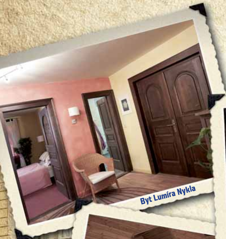
Byt Lumíra Nykla