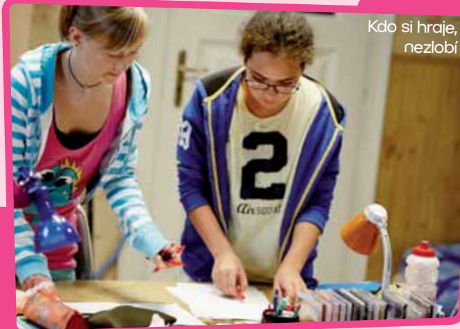
Kdo si hraje, nezlobí